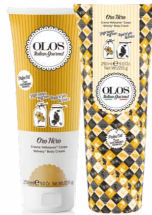
Oro Nero Crema Vellutante+ Corpo Zafferano & Liquirizia

Ingredienti inaspettati per un menù prelibato