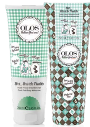
Br...Brivido Freddo Fluido Fresco Idratante Corpo Menta & Caffè