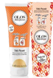
Dolce Piccante Balsamo Idratante Mani e Unghie Albicocca & Peperoncino