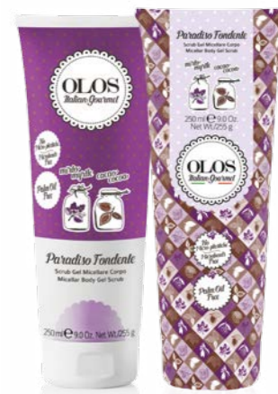
Paradiso Fondente Scrub Gel Micellare Corpo Mirto & Cacao